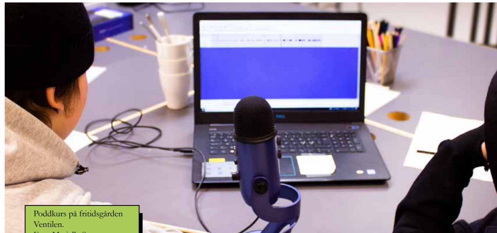
Poddkurs på fritidsgården Ventilen.

Men den påskyndade digitaliseringen har skett snabbt och delvis utan konsekvensanalyser av hur detta påverkar kulturens bredd och djup på längre sikt. Kulturlandskapet kommer troligen att se annorlunda ut i framtiden. Digitaliseringen leder till att allt fler vill vara medskapare snarare än konsumenter, vilket i sin tur ställer högre krav på samverkan och verksamhetsutveckling. Digitaliseringen finns också med som en faktor bakom de ökade klyftor vi ser ekonomiskt, socialt och kunskapsmässigt. För att ta del av den digitala utvecklingen krävs både kunskap och teknisk utrustning, vilket gör att vissa grupper får ett allt tydligare försprång. De grupper som hamnar på en digital efterkälke får också högre trösklar till demokratin i samhället och till den utveckling som sker i ett framtida digitalt landskap.