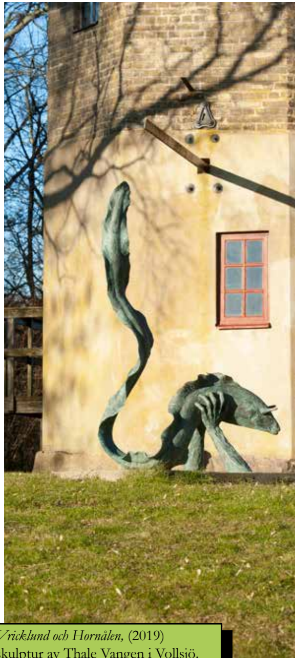
Vricklund och Hornålen, (2019) skulptur av Thale Vangen i Vollsjö.

I grunden handlar det om människans rätt till demokrati, yttrandefrihet och känsla för tillhörighet, och både de mänskliga rättigheterna och barnkonventionen lyfter rätten till kultur. Kulturen öppnar på flera olika sätt upp för individen att tillförskansa sig kunskap, kompetens och bildning. Kulturen pekar framåt och bakåt, och historia och kultur är nära sammanbundna. Genom kulturen får vi avtryck som hjälper oss att förstå och empatisera med våra föregångare och vår egen historia. Mångfalden och kraften i att människor möts genom kultur och får pröva sina idéer utifrån egna förutsättningar bidrar till ett varmt och inkluderande samhälle. Detta är viktigt för en orsts attraktivitet, där kulturutveckling bidrar till samhällsutveckling i ett större perspektiv.