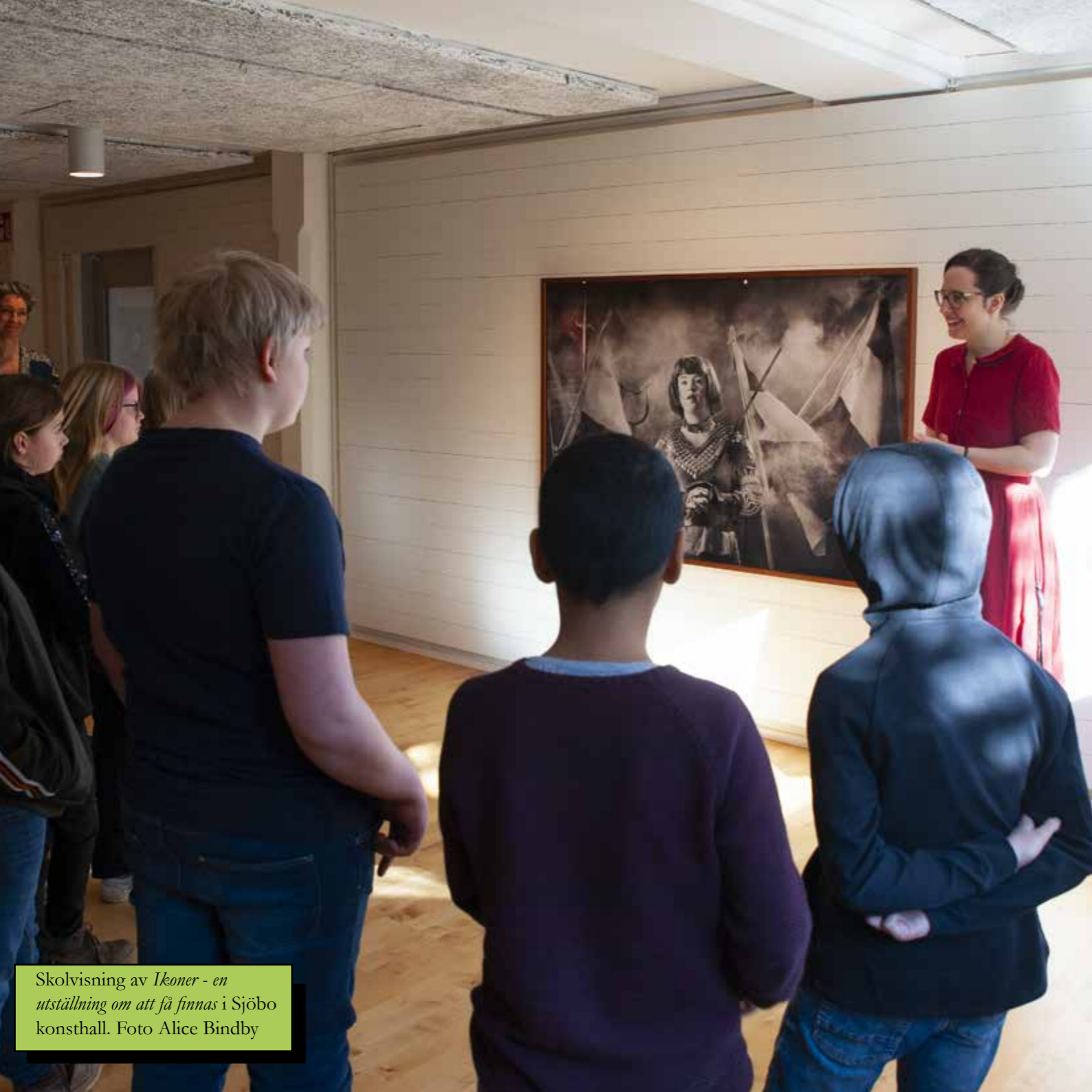
Skolvisning av Ikoner - en utställning om att få finnas i Sjöbo konsthall.